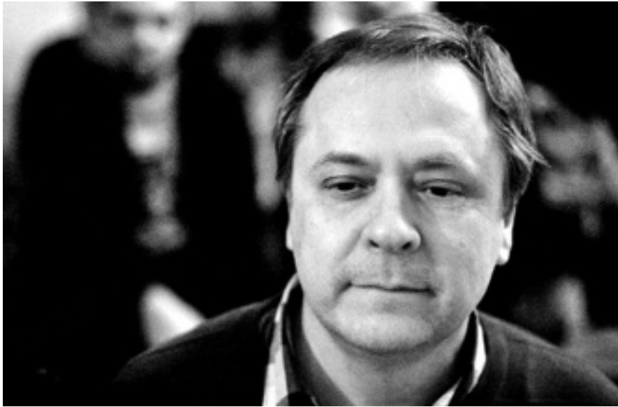
Поэт, прозаик. Живет в Москве.